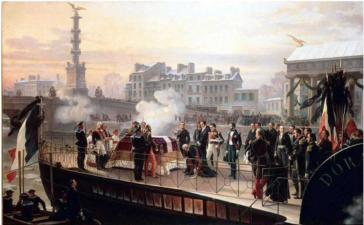
15 december 1840: Napoleon komt thuis in La Patrie.