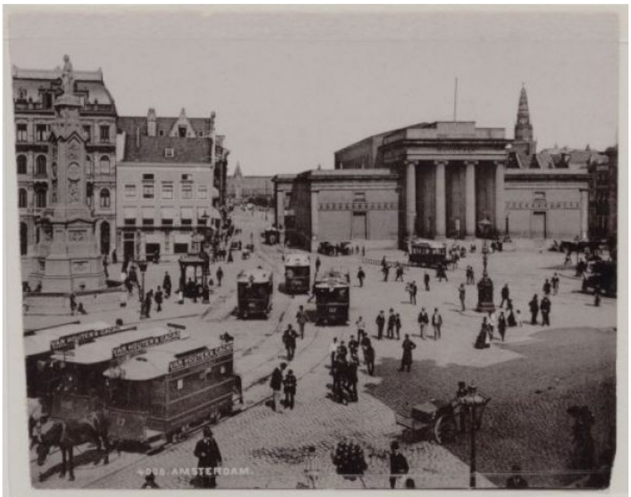
Amsterdam in het tweede gedeelte van de 19e eeuw, met rechts de beurs van Zocher en in het midden op de achtergrond het Centraal Station. Opvallend hoe smal het Damrak toen was. Met de sloop van de Beurs van Zocher zou dat probleem worden opgelost.

De beurs van Hendrick de Keyser, geopend in 1611, was de eerste beurs ter wereld waar aandelen werden verhandeld. In 1838 werd het gesloopt in verband met verzakkingsproblemen, en het gemeentebestuur gunde de Haarlemse architect Jan David Zocher de opdracht tot bouw van een nieuwe beurs. Het wat pompeuze gebouw in Neoclassicistische stijl, dat oogde als een Griekse tempel, kwam te staan op de hoek van de Dam en het Damrak, op de plaats waar nu De Bijenkorf is gevestigd. Op 10 september 1845 werd het geopend door koning Willem II. Eind 19e eeuw voldeed het gebouw niet langer. In 1903 werd het gesloopt en vervangen door de Beurs van Berlage.